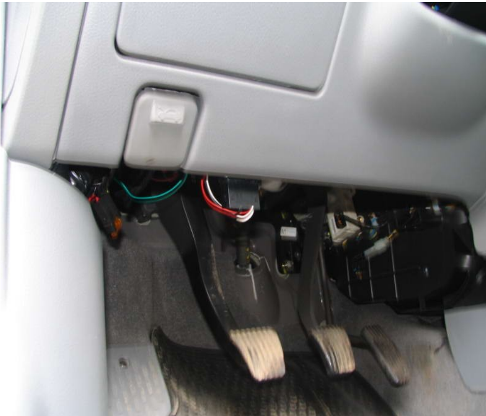
Общий вид разъема издали