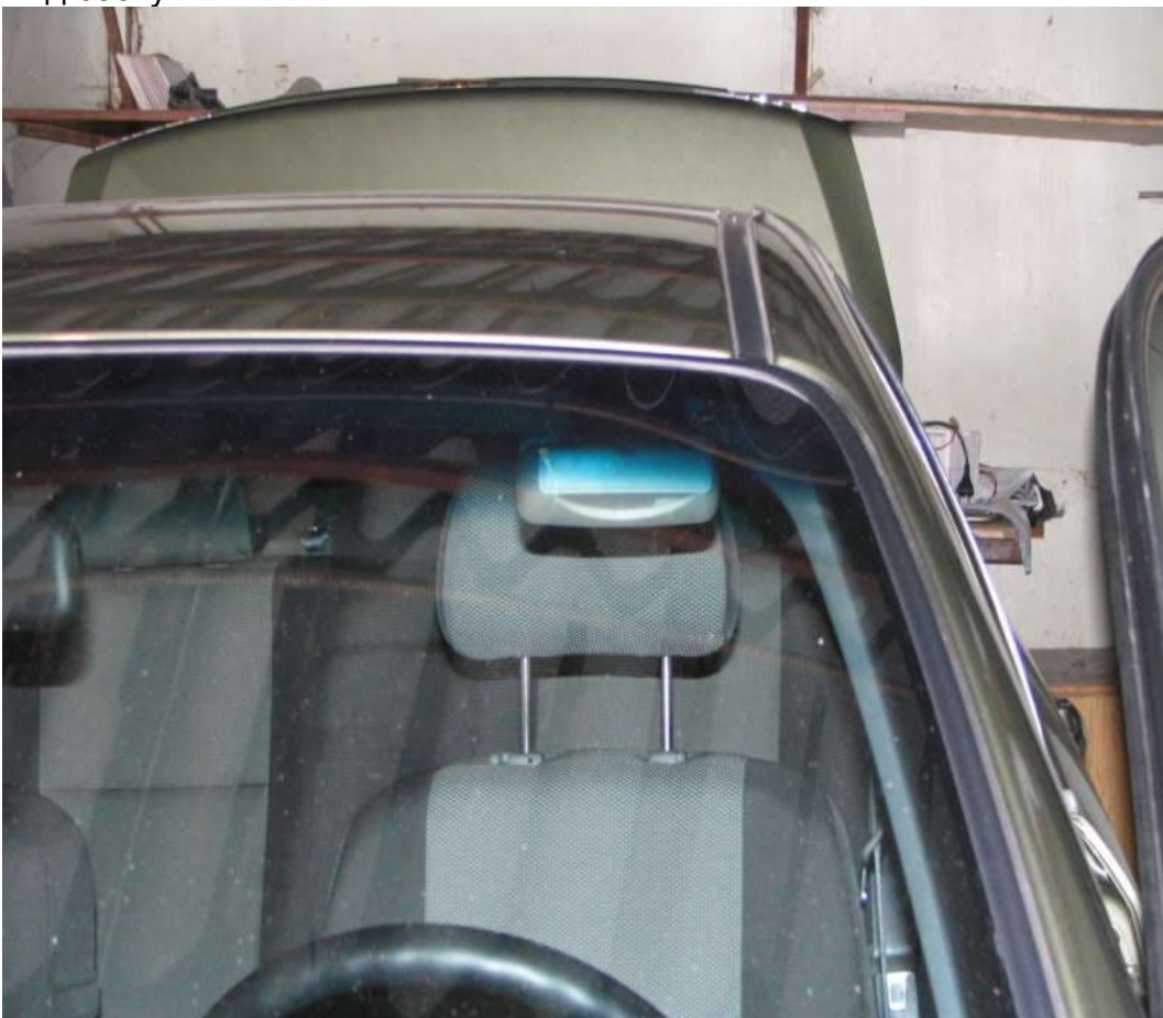
Вот вид снаружи. Обзору не мешает, козырек от солнца открывается. Вполне доволен. Теперь впереди калибровка и изучение миллиона его функций